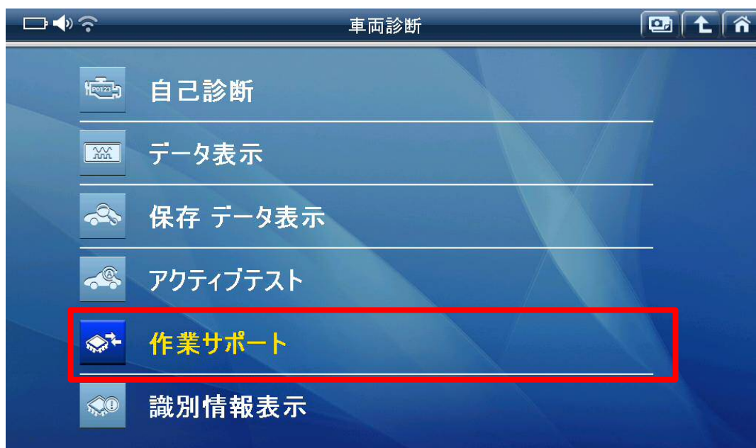
〈図: 作業サポートを選択〉