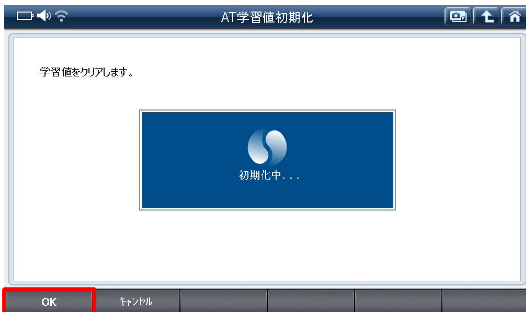
〈図:AT 学習値初期化中〉