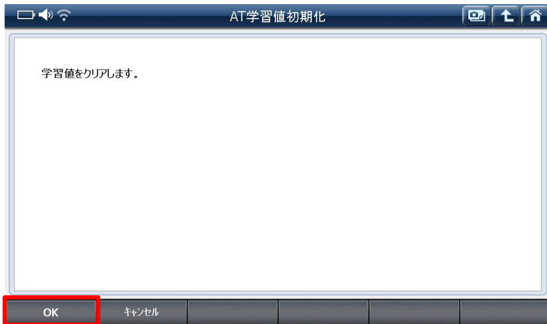
〈図:AT 学習値初期化実行〉

5. 『AT 学習値初期化』画面が表示されます。『AT 学習値初期化』を実行して学習値をクリアして下さい。