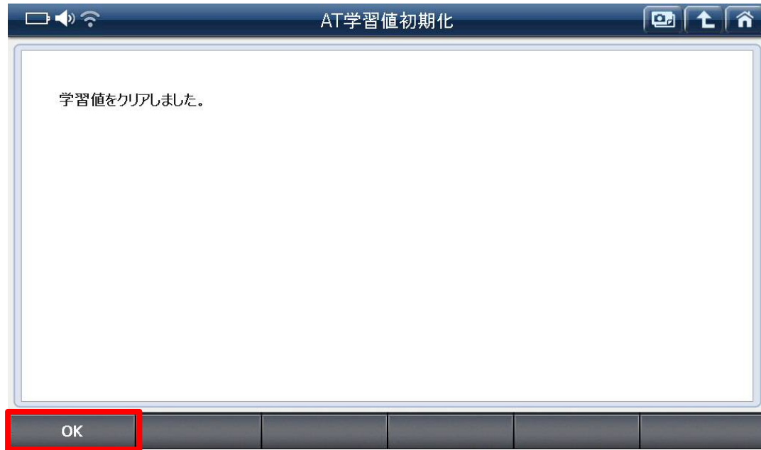
〈図:AT 学習値初期化完了〉