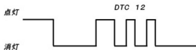
<図:故障コード表示例>