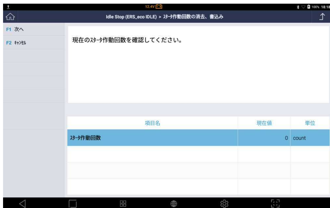
〈図: スタータ作動回数の確認〉