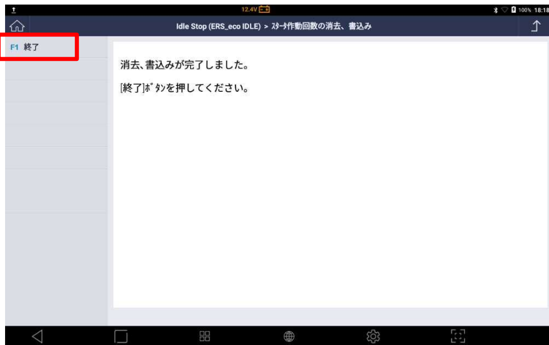
〈図: 消去、書込み完了〉