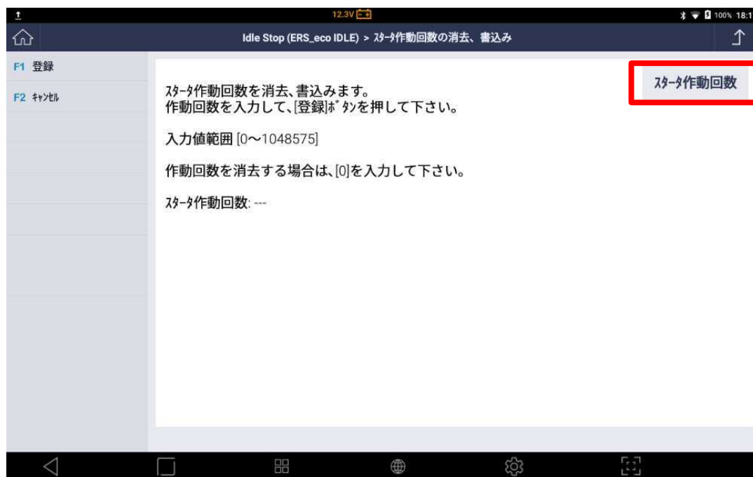
〈図: スタータ作動回数の入力〉