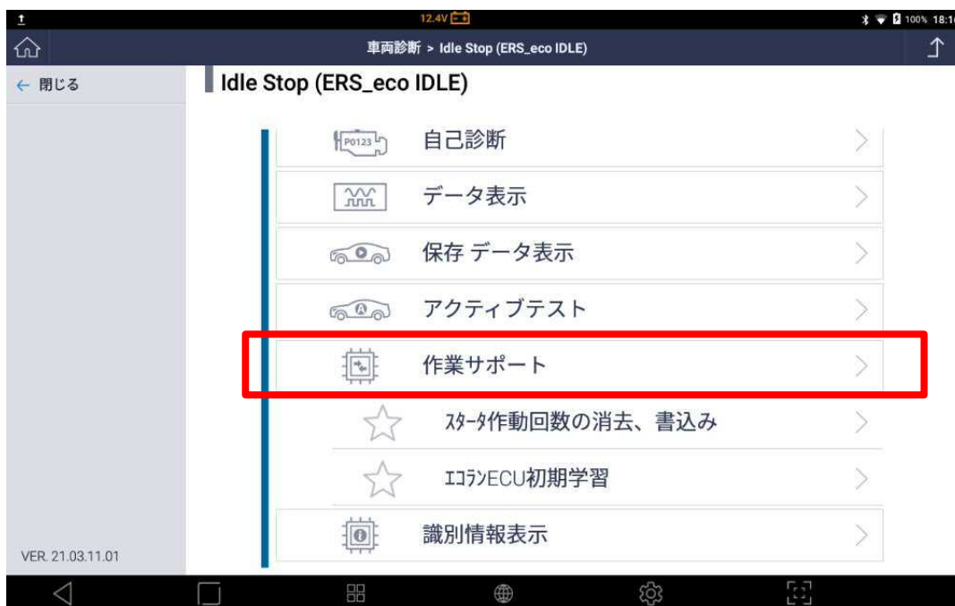
〈図：作業サポートを選択〉