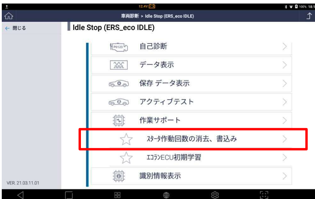
〈図：スタータ作動回数の消去、書込みを選択〉