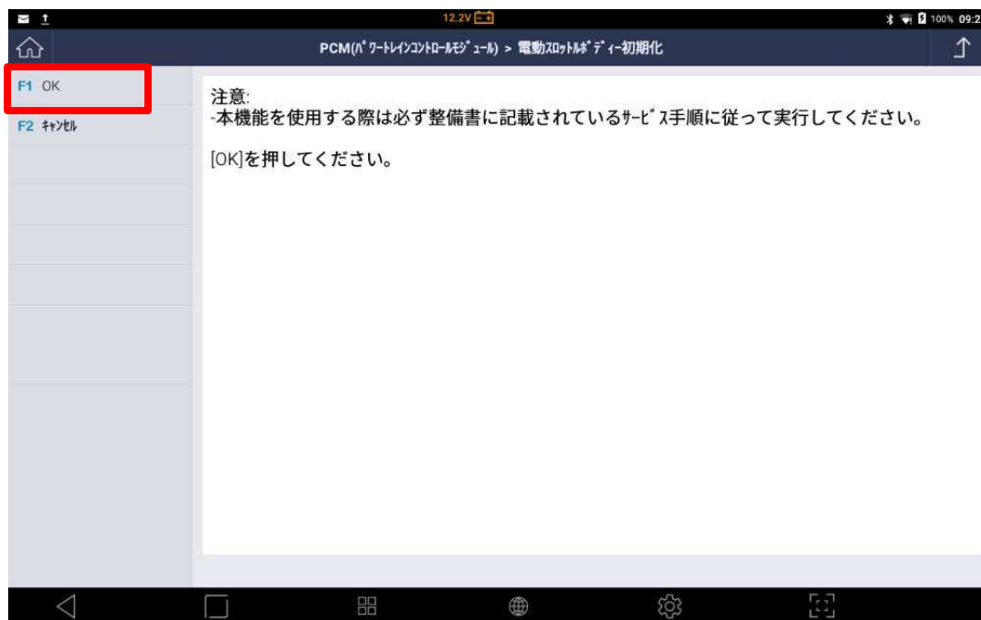
〈図: 注意メッセージの確認〉