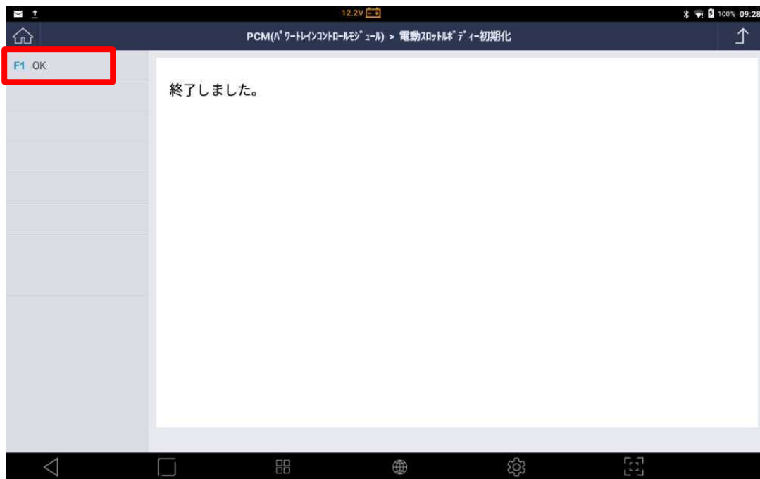
〈図: 終了、初期化完了〉