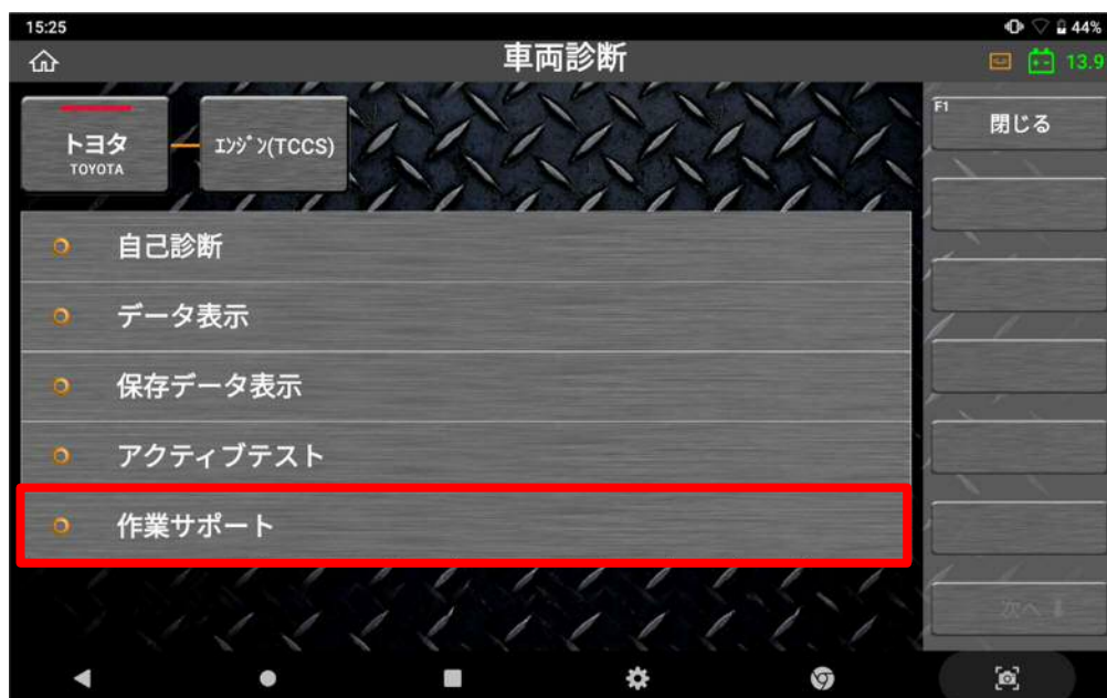
〈図: 作業サポートを選択〉