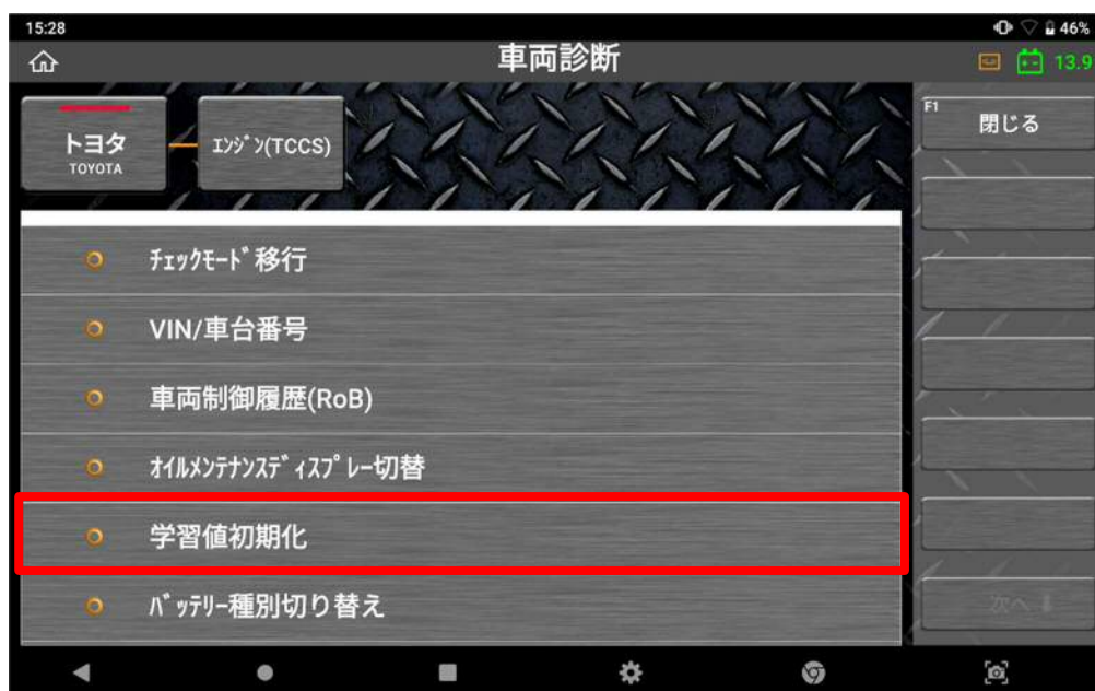
〈図: 学習値初期化を選択〉